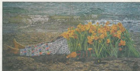
Óleo de Manuel Chavajay (2003). Espacio 'Nunca es lo mismo'.