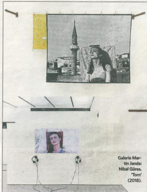
Galería Martín Janda: Nibal Gúres. 'Torn' (2018).

También veremos este año las secciones Opening by Allianz , dedicada al galerismo joven, y Nunca lo mismo. Arte Latinoamericano . Este segundo espacio compila una selección de 11 galerías que