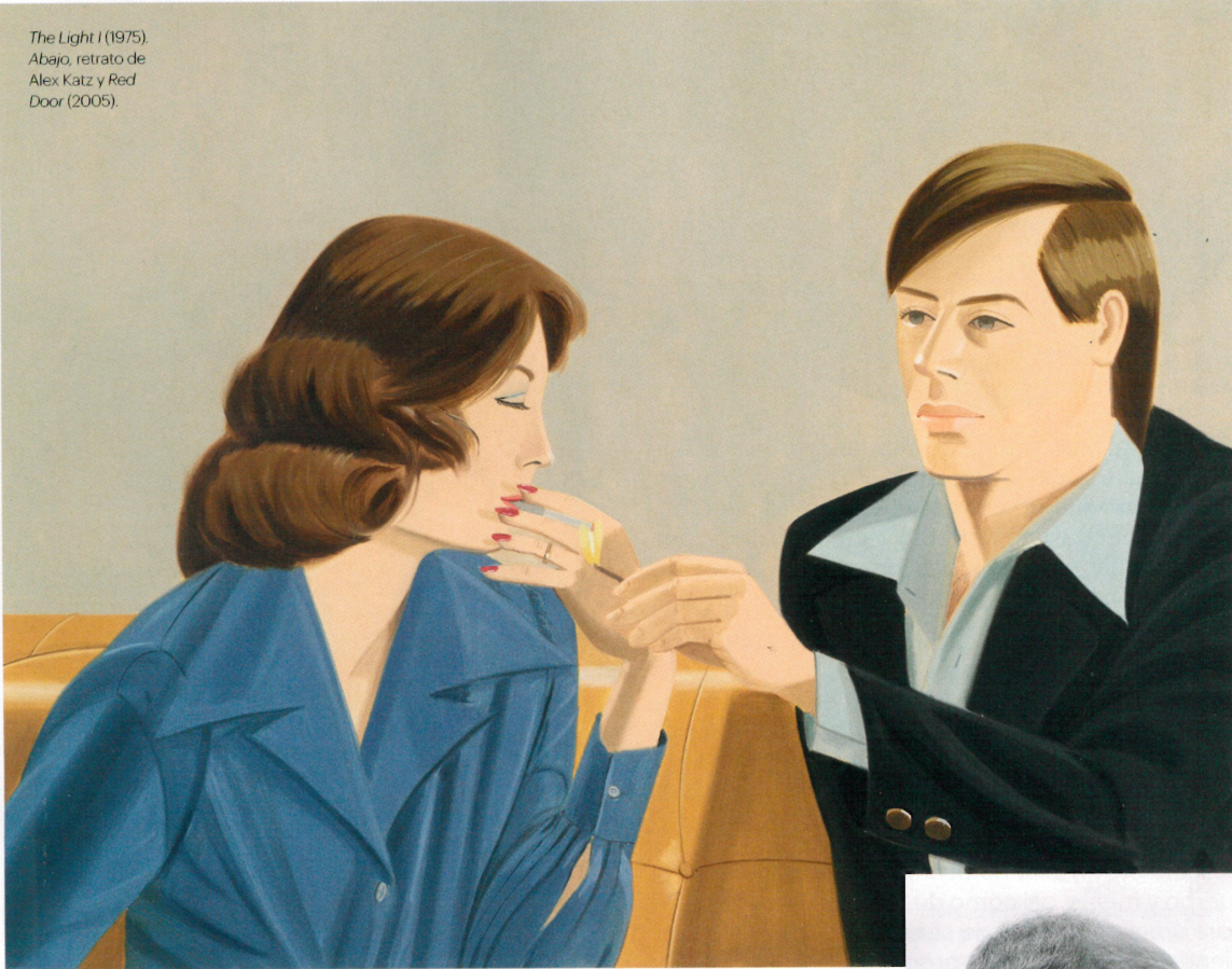
The Light I (1975). Abajo, retrato de Alex Katz y Red Door (2005).