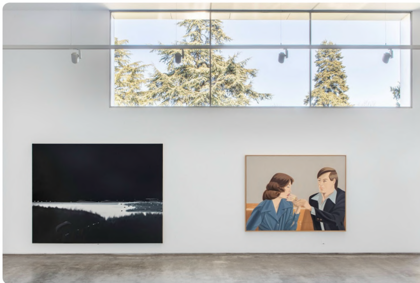
📍 López de la Serna CAC - Centro de Arte Contemporáneo

López de la Serna CAC cuenta con una trayectoria de más de 25 años en el mundo del arte, pero desde 2022 se erige como centro de arte contemporáneo privado, cuyo objetivo es impulsar proyectos con un enfoque singular y desarrollar un programa de exposiciones en colaboración con artistas e instituciones tanto nacionales como internacionales.