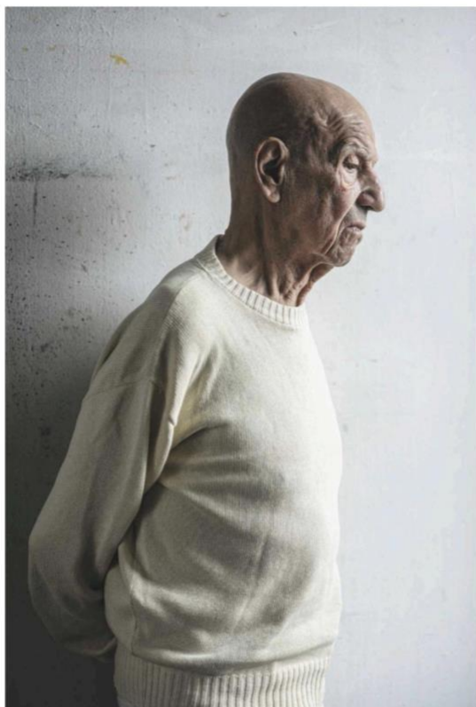
Sobre estas líneas, otra imagen del pintor estadounidense.

de las descripciones que le acompañan asiduamente. Quizás sea uno de sus principales valores, la dificultad de incluirle en una categoría. "Hay en él algo de arte pop," explica López de la Serna, como el uso de los colores planos y brillantes, la preferencia por las escenas cotidianas, la transformación de la imagen a través de su repetición y fragmentación o la influencia de los medios de comunicación de masas, cuyo surgimiento y boom acompañó los inicios de Katz en las décadas de los 50-60 del siglo pasado. "Pero hay también algo de abstracción, sobre todo en los paisajes –continúa–, y de pintura figurativa en los retratos, a los que, además, dota de cierto aire renacentista, especialmente en la forma de posar."