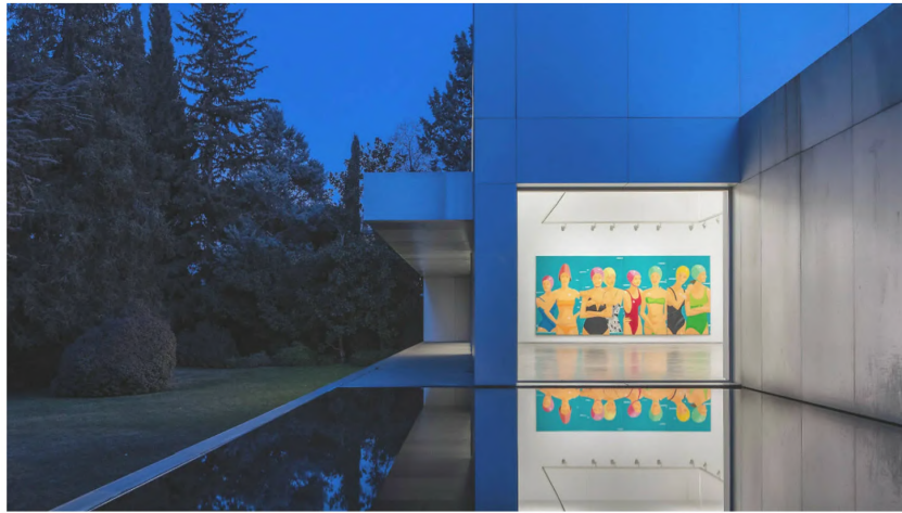
López de la Serna CAC - Centro de Arte Contemporáneo

Madrid puede presumir de tener numerosos espacios de arte por toda la ciudad y la región y entre ellas se encuentran galerías de grandes personalidades, como Helga de Alvear , hasta zonas donde el arte emergente está transformando el ambiente del barrio, como ocurre con Carabanchel. Y entre tantas e interesantes opciones, hay una escondida junto al parque del Monte el Pardo en el que el arte, la arquitectura y la naturaleza se fusionan en un escenario único.